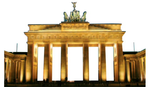
Brandenburger Tor er den eneste bevarede byport og blev åbnet i 1989