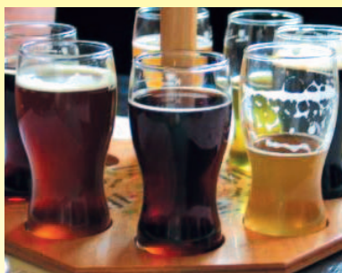
Det berømte tjekkiske øl