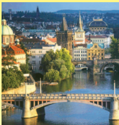
En af Prags mange broer