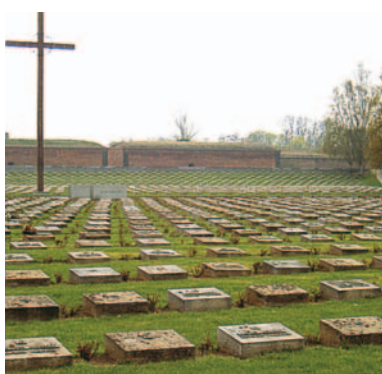
Op til 50.000 var indespærret i koncentrationslejren Theresienstadt under 2. verdenskrig.